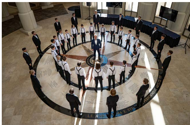
fol. materiały prasowe, 2x