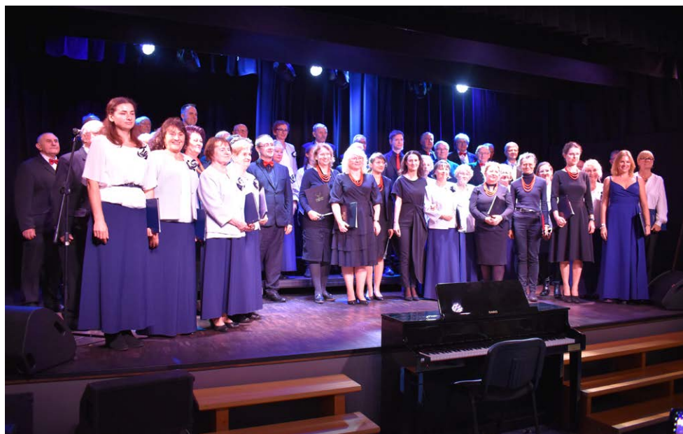
Jesienne Święto Pieśni 2023

Jesienne Święto Pieśni – Koło Śpiewu im. Feliksa Nowowiejskiego i goście 6.10 (niedziela), g. 15, DK w Tarnowie Podgórnym. Wstęp wolny