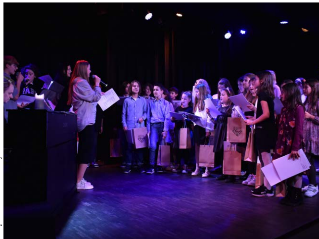
Rozśpiewana Gmina 2023