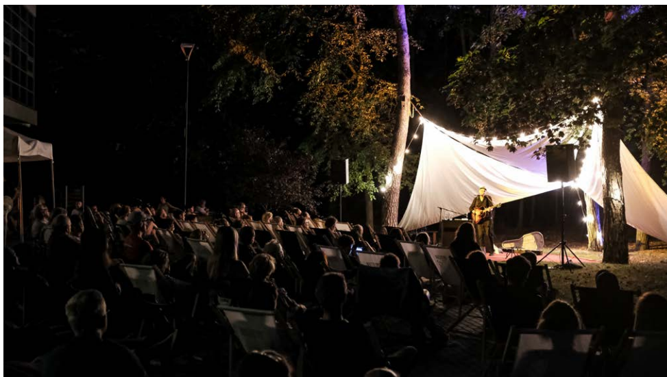
My Photo Wąsy, 2x