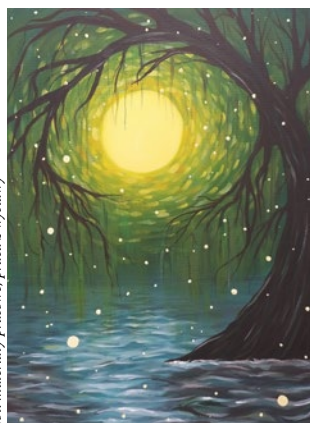
fol. materiały prasowe, praca z wystawy

„Dzika przyroda i parowozy w obiektywie” – spotkanie z fotografem Waldemarem Woźniakiem 6.05 (wtorek), g. 18, DK w Tarnowie Podgórnym. Wstęp wolny