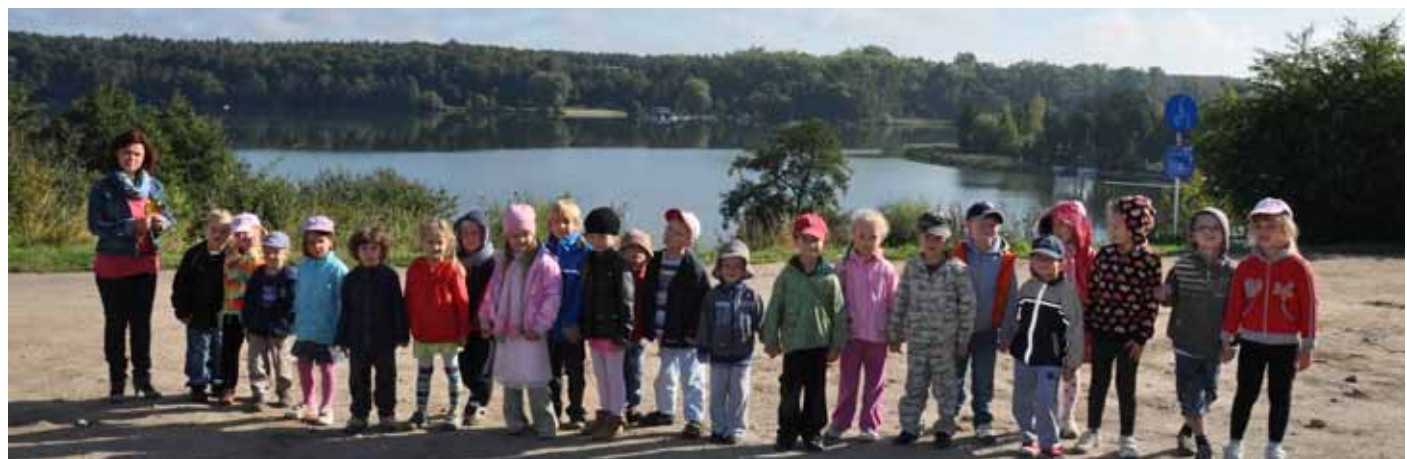
„Mali odkrywcy” z przedszkola w Baranowie na porannym spacerze. W tle Jezioro Kierskie.